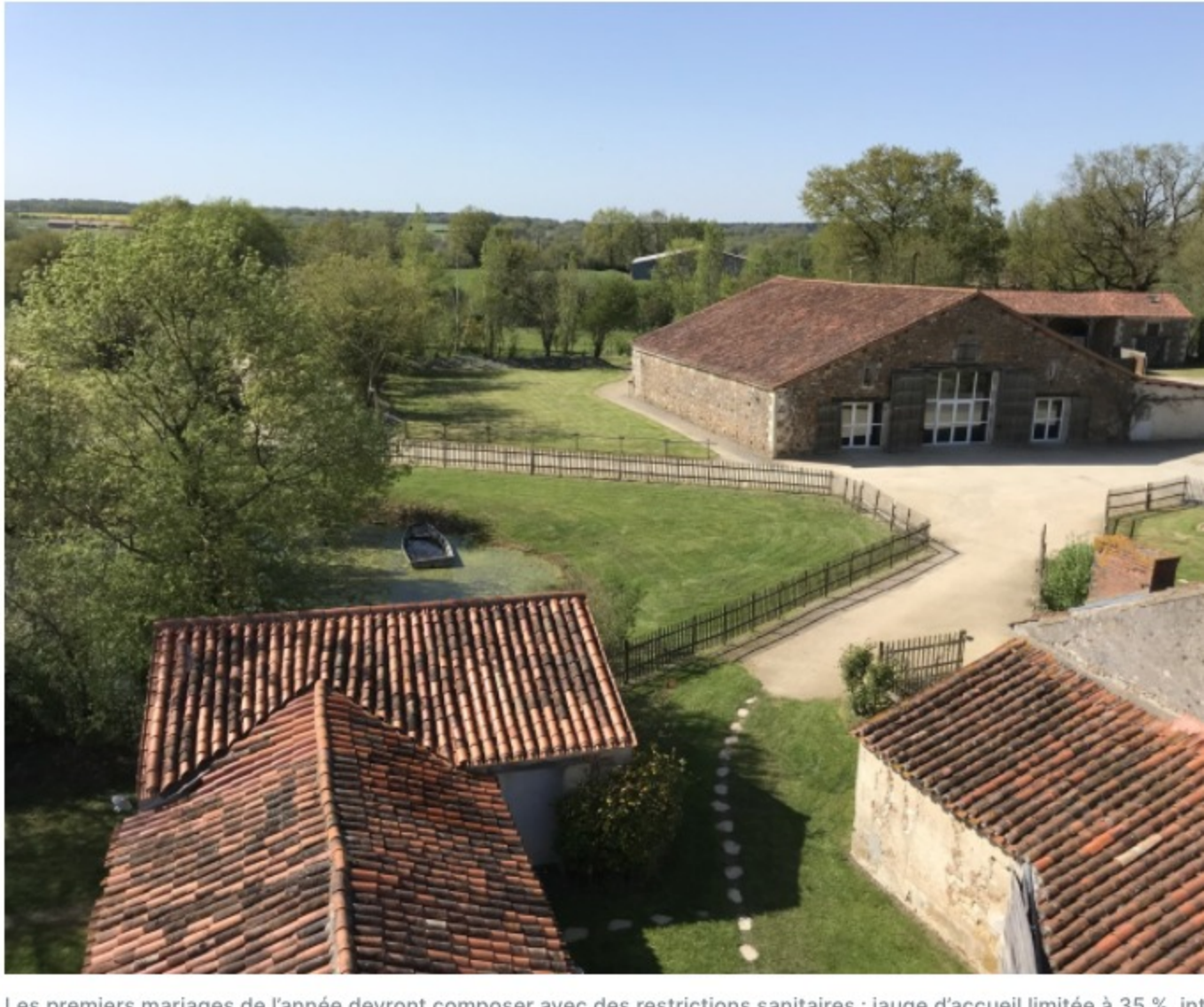
Les premiers mariages de l'année devront composer avec des restrictions sanitaires : jauge d'accueil limitée à 35 %, interdiction d'organiser des repas à l'intérieur, danse à l'extérieur.

Les conditions imposées par le Gouvernement (couvre-feu, repas à l'extérieur...) devraient conduire les couples vendéens à organiser leur mariage en deux temps.