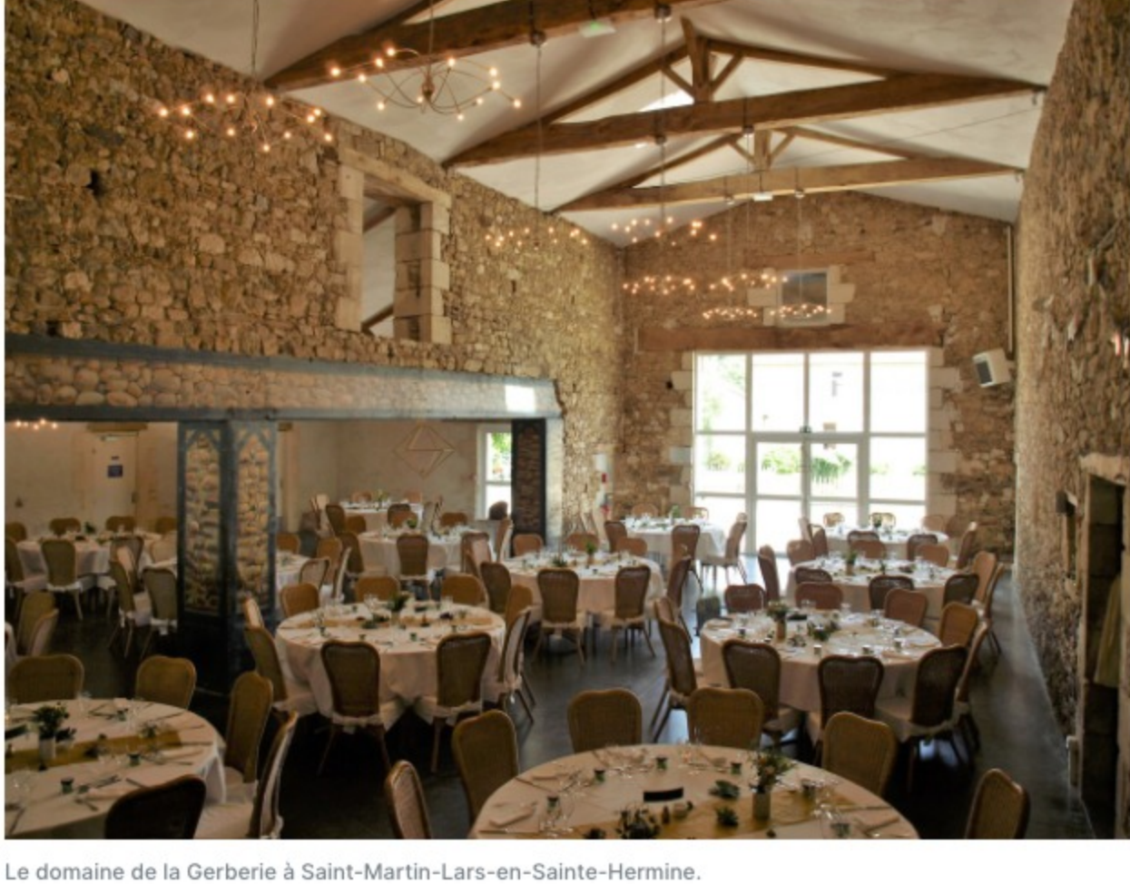
Le domaine de la Gerberie à Saint-Martin-Lars-en-Sainte-Hermine.